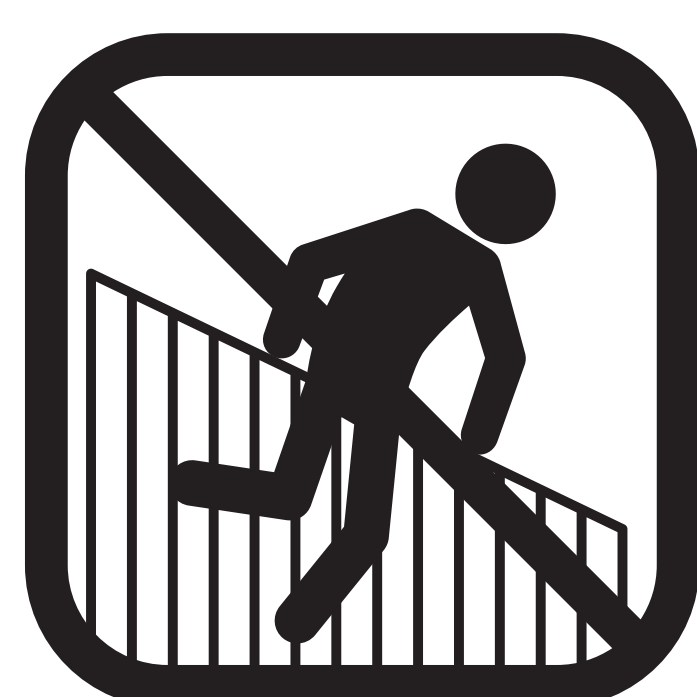
Forcering af hegn

Betaling af ovennævnte afgifter udelukker ikke anvendelse af øvrige sanktioner og retsforfølgelse med krav om erstatning.